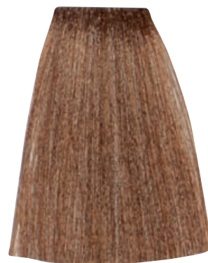
BIONDO CHIARO DORATO