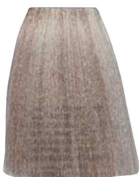
BIONDO NATURALE PLATINO