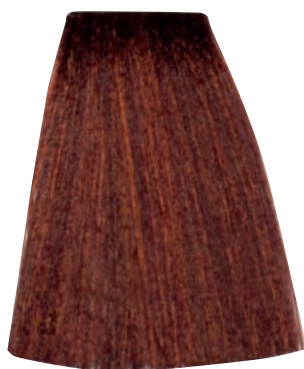
BIONDO SCURO RAME