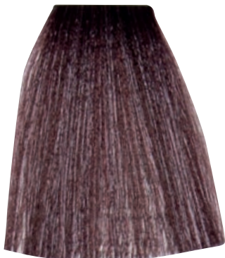
BIONDO CENERE IRISÉ