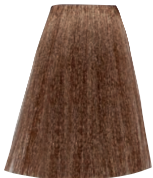
BIONDO CHIARISSIMO DORATO