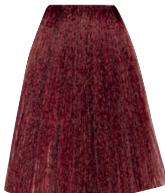
BIONDO ROSSO INTENSO