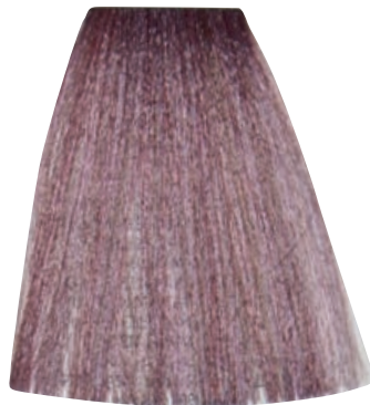
BIONDO CHIARISSIMO CENERE IRISÉ