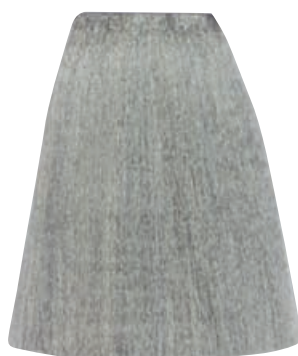
BIONDO CENERE PLATINO