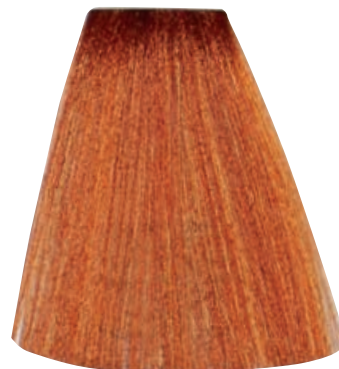
BIONDO CHIARO RAME