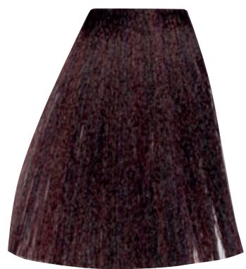
CASTANO CHIARO ROSSO INTENSO