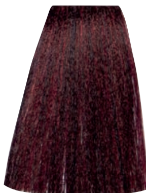
BIONDO SCURO ROSSO INTENSO