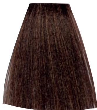
CASTANO CHIARO DORATO