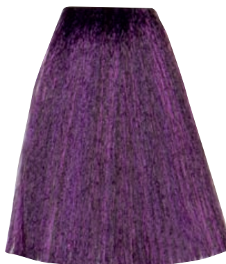
BIONDO VIOLA INTENSO