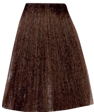
BIONDO SCURO DORATO