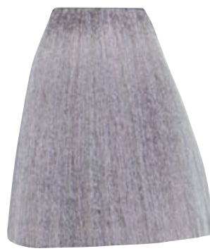
BIONDO PLATINO IRISÉ