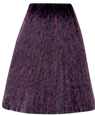
BIONDO SCURO VIOLA INTENSO