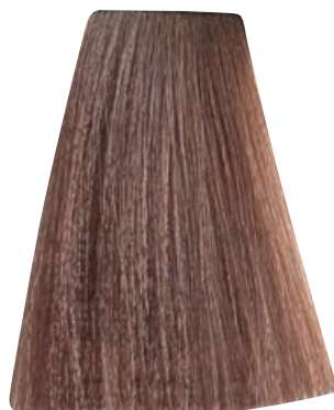
BIONDO CHIARISSIMO DORATO RAME