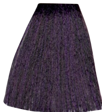
CASTANO CHIARO VIOLA INTENSO