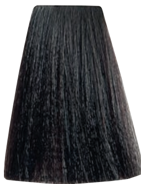
CASTANO CHIARO DORATO MOGANO